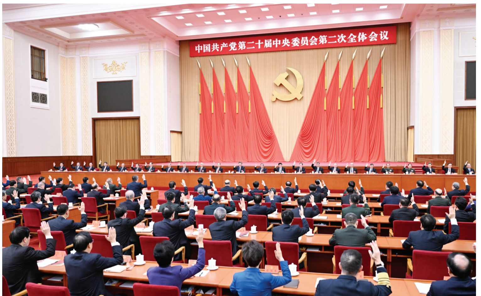
中国共产党第二十届中央委员会第二次全体会议,于2023年2月26日至28日在北京举行。中央政治局主持会议。