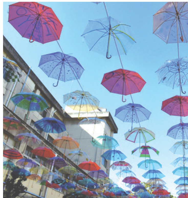
为了让学生们在仰望天空的时候能够消除新冠疫情带来的沉闷气氛，位于日本爱知县日进市的县立西进高中三年级学生，日前用青、红、橙、黄等不同颜色的320把雨伞将校舍的天井装饰一新。(摘自人民网)

(上接一版)明确对潜在受害人预警劝阻和开展被害人救助。这一系列制度设计更加强调立法的针对性、实用性和有效性。 反电信网络诈骗势必是一场攻坚战、持久战。无论是完善治理体系，还是有效提升公众反诈反诈意识，都难以一蹴而就。从动态监测到全链条打击，从有效反制到联防联控，这都需要久久为功，凝聚各方合力，不断优化提升。